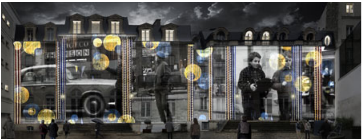
Façade du Conseil Régional d'IDF Barbey de Jouy « film « Les Quatre Cents Coups » de François Truffaut.

Passionné par l'image et le cinéma, associé un temps à Henri Alekan, proche de Raymond Depardon, dont il possède une table de montage, il est collectionneur d'anciennes pellicules des films de l'histoire du cinéma qu'il introduit dans ses œuvres fixes et projetées et qui en forment la trame.